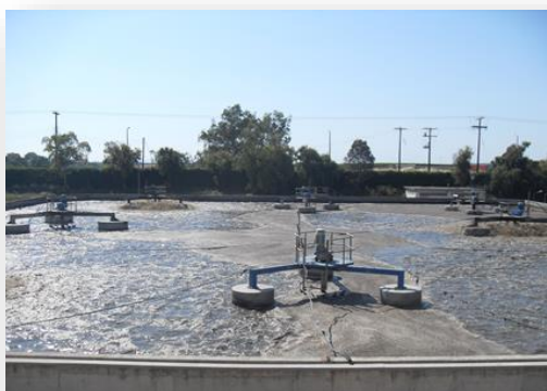
Βιολογική Επεξεργασία στη Βιομηχανική Περιοχή Πατρών

Η Hellas Environment προσφέρει ολοκληρωμένες υπηρεσίες σε θέματα κατασκευής, λειτουργίας, συντήρησης και αναβάθμισης εγκαταστάσεων επεξεργασίας βιομηχανικών αποβλήτων, αστικών λυμάτων και νερού αστικής ή βιομηχανικής χρήσης.